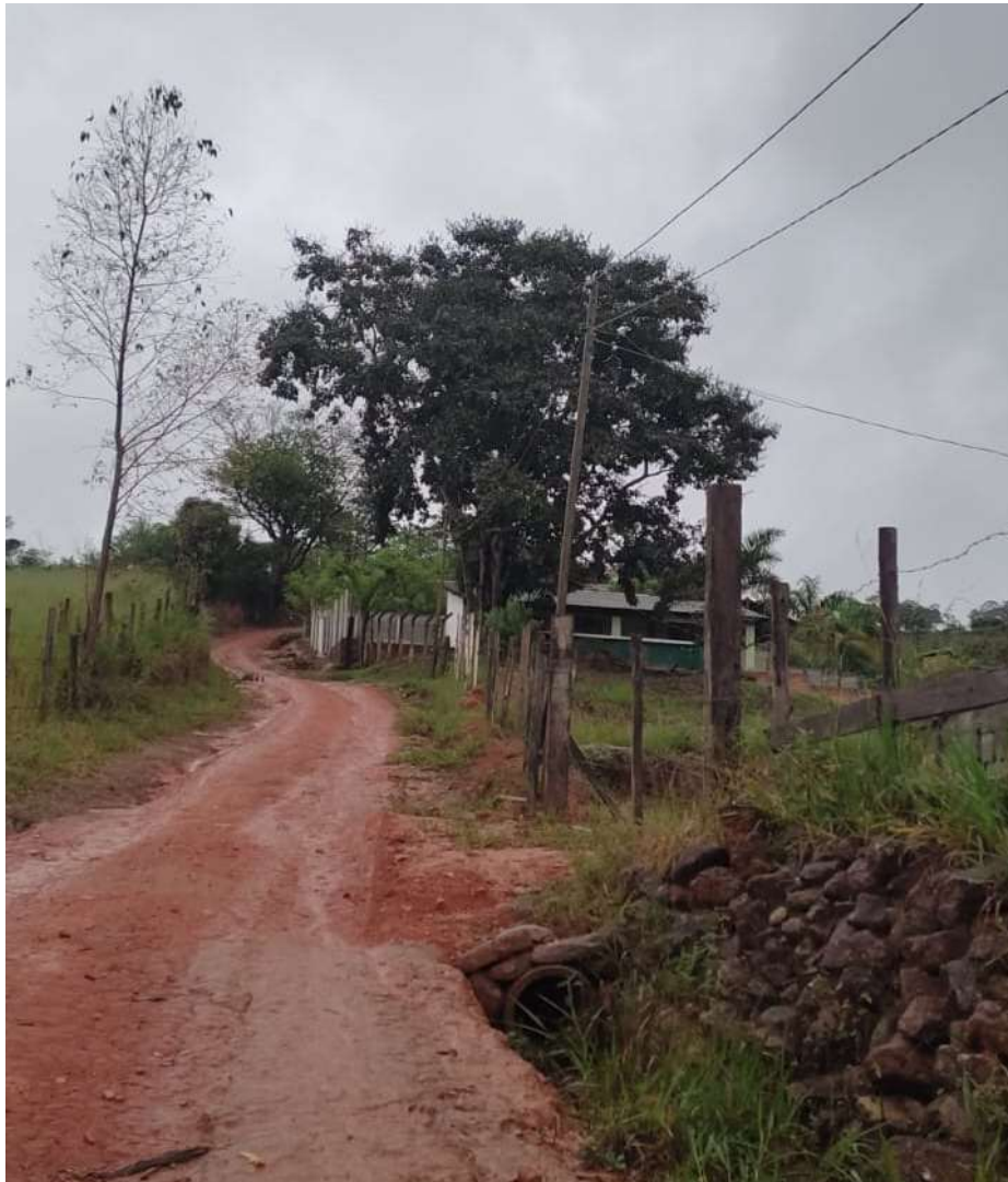
Imagem 02 - Trecho a pavimentar