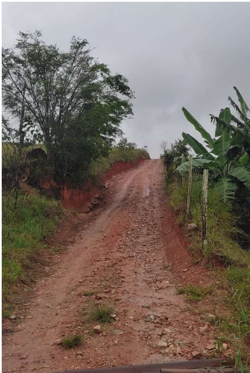
Imagem 01 - Trecho a pavimentar