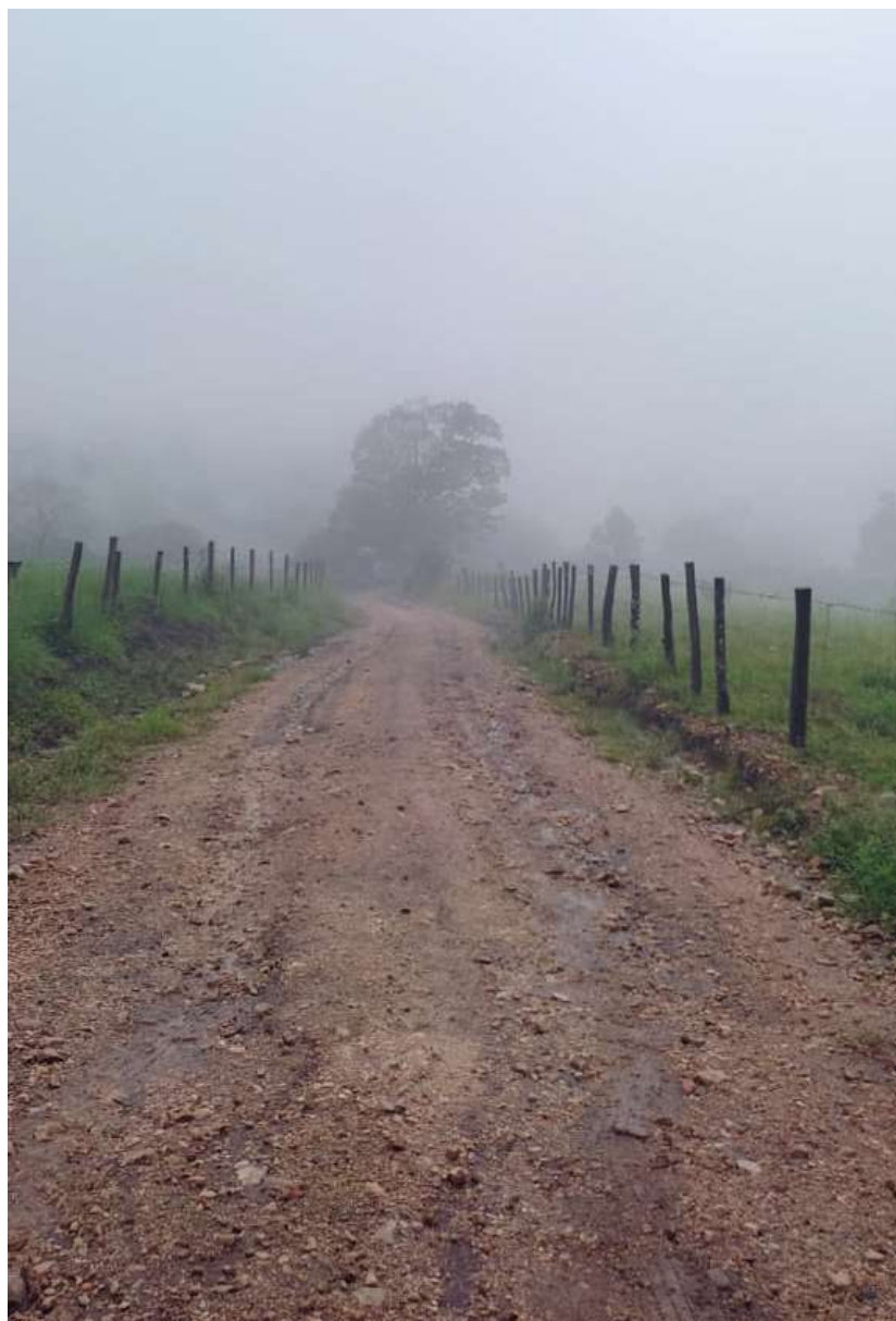
Imagem 02- Trecho a pavimentar