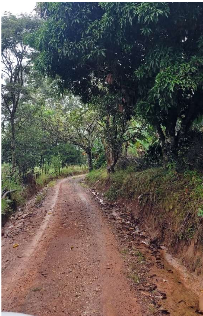
Imagem 05- Trecho a pavimentar