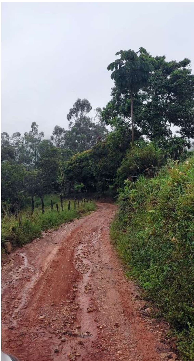
Imagem 06 - Trecho a pavimentar