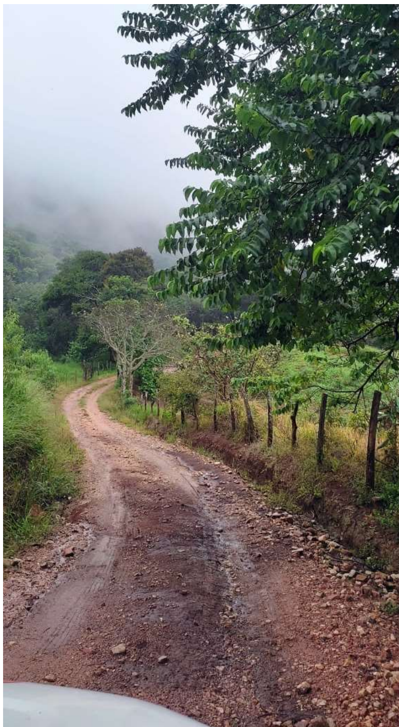
Imagem 04- Trecho a pavimentar