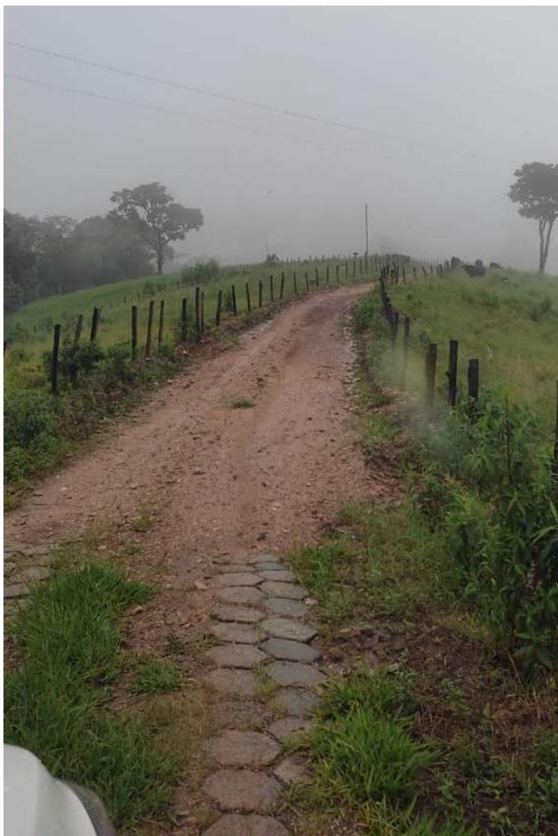
Imagem 01- Trecho a pavimentar

TRECHO I – ESTRADA DA CURVA DA FERRADURA